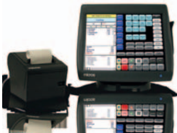
Zur Internorga 2009 präsentiert Micros zum Beispiel das flexible Kassenterminal WS52.