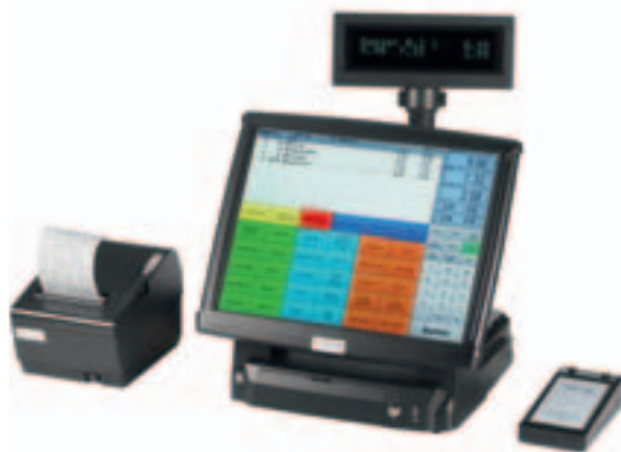
contidata Kasse MAXXcash